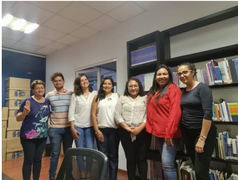
Sesión de Instalación del comité de Vigilancia de FOBAM 2023