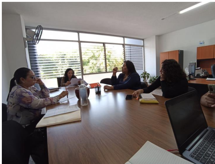
Reunión con el CADPE

Barranca del Muerto No. 209, Col. San José Insurgentes, CP. 03900, Alcaldía Benito Juárez, Ciudad de México. Tel: (55) 5322 6030 www.gob.mx/inmujeres