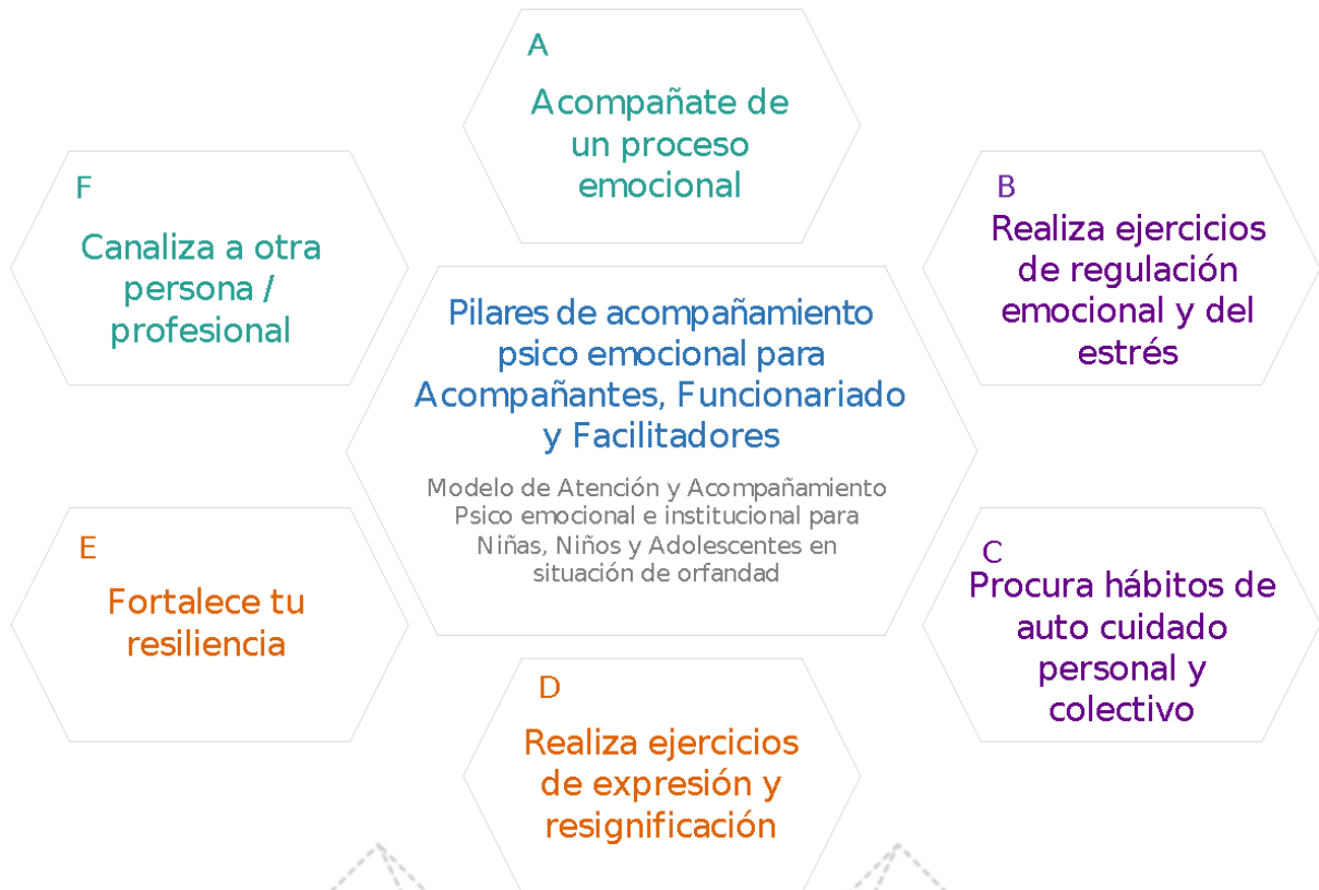
Figura 4. Pilares de acompañamiento psicoemocional para acompañantes, funcionariado y facilitadores

suficientes para el proceso; para que esto ocurra es necesario que reciba también un acompañamiento de preparación basado en los siguientes pilares: