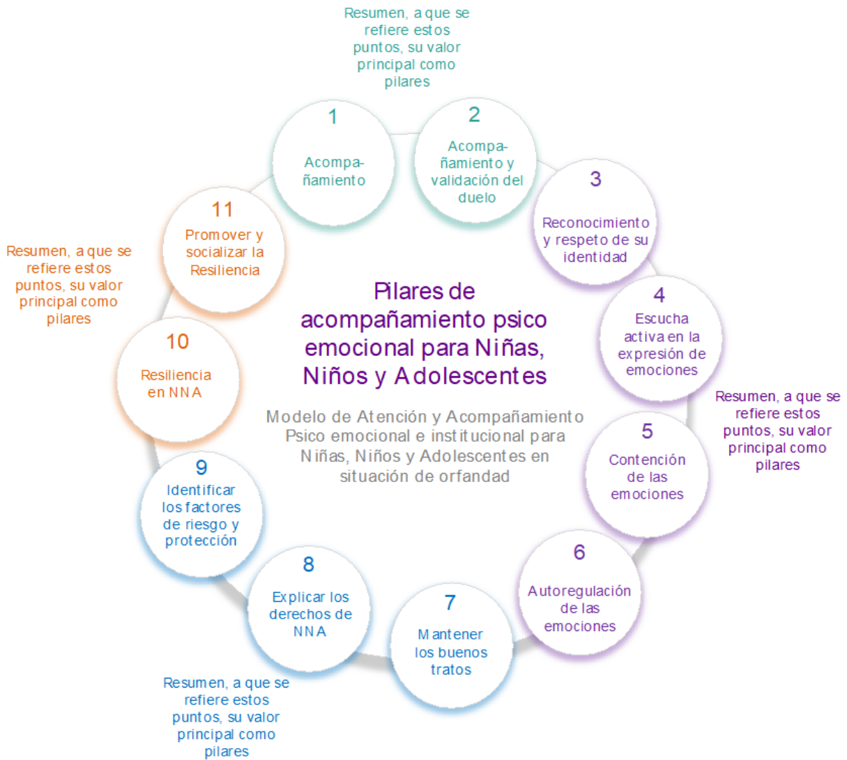
Figura 3. Pilares para el acompañamiento psico emocional para Niñas, Niños y Adolescentes (NNA)